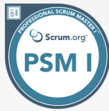
Professional Scrum Master 1