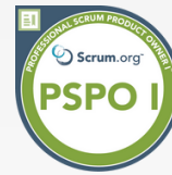
Professional Product Owner 1